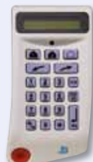
2-Wege Funk-Bedienteil 868MHz 4 Jahre Batteriebensdauer