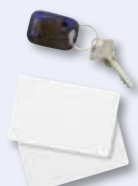
2-Wege Funk-Außen-Proximity-Leser 868MHz 4 Jahre Batteriebensdauer