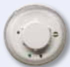
2-Wege Funk-Rauchmelder 868MHz - 4 Jahre Batteriebensdauer