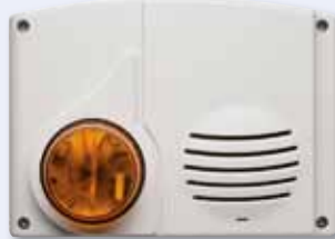
2-Wege Funk-Alarmierung • 868MHz 4 Jahre Batteriebensdauer Alarmierung still oder akustisch? Der Wachmann entscheidet individuell nach Erhalt der Videosequenz