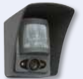
2-Wege Funk-PIR-Außenmelder 868MHz mit IR/Kamera 2 Jahre Batteriebensdauer