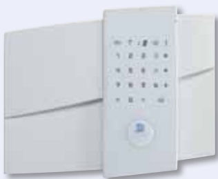
Alarmzentrale mit bis zu 4 Jahren Batteriebensdauer Übertragung der Alarme und Videosequenzen via Mobilfunknetz und mit Integrierter Chipleser